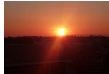
【元旦 東の空から初日の出】

今年の干支は、「酉」（とり）です。酉年生まれの方は、きめ細かな気配りができる情緒豊かな人、人に尽くす性格で自然とその行動ができるそうです。南小の子供たちも、周りの人たちに気配り、思いやりをもって接することができることを願っています。私は、毎年家族と近くの神社に初詣に行き1年間、無病息災を願います。そして、南小の子供たちが、地に足をつけ、足下を見て、一日一日を有意義に過ごし輝かしい未来へ向かって羽ばたけるようにと祈願しました。